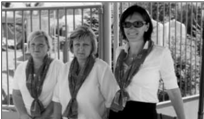
ZAMĚSTNANKYNĚ KOVODRUŽSTVA VE FIREMNÍCH BARVÁCH

Kovodružstvo v.d. Strážov, které si v letošním roce připomíná sedmdesáté výročí svého založení, přichystalo u příležitosti tohoto jubilea na pátek 3. července velkolepé oslavy. Vše začalo již před polednem prohlídkou výrobního závodu. Návštěvníci, kterých přišlo více než 350, měli možnost zhlédnout administrativní i výrobní prostory. Nejedna bývalý zaměstnanec obdivoval obnovu strojního parku, kterému vévodí nejmodernější CNC stroje na zpracování plechu.