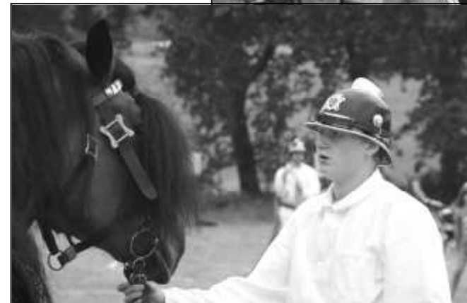
HASIČI Z NĚMČIC SE PŘEDSTAVILI V NÁDHERNÝCH REPLIKÁCH HISTORICKÝCH UNIFORM

Odpolední hasičské soutěže se zúčastnily sbory nejen z našeho okrsku, ale i ze širšího okolí. Příjemnou náladu podpořila také následná taneční zábava na místním parketu u nové hasičské zbrojnice.