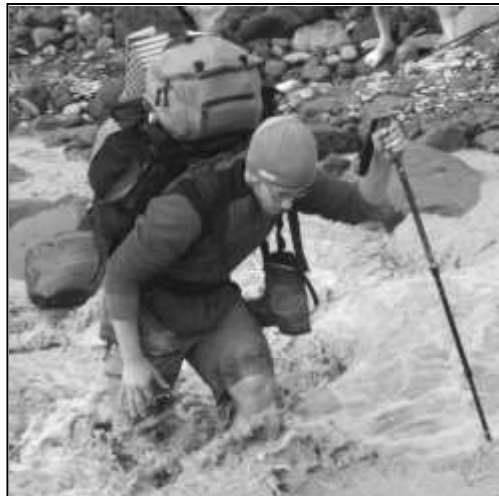
ZDOLÁVÁNÍ DIVOKÉ ŘEKY

Tentokrát nás letošní prázdninová výprava zavedla na východ Evropy, do Gruzie na Kavkaz. První část dobrodružství spočívala v překonání zhruba sedmdesátikilometrového treku u samotných hranic s Ruskem, konkrétně v Čechenskem. Tento trek zabral víceméně celou první polovinu výpravy a cestou bylo nutné překonat dvě relativně vysoko položená sedla Isirtgele a Archotské, která se pohybovala ve výškách kolem 3 500 m n. m.