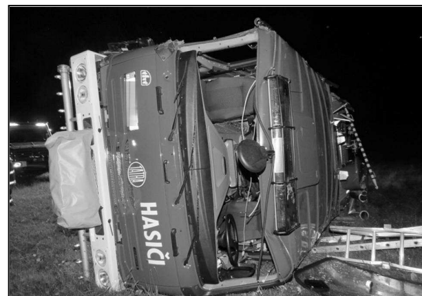
TATRA SDH STRÁŽOV KRÁTCE PO NEHODĚ

V pondělí 13. července 2015 krátce před půlnocí byli strážovští hasiči povoláni k požáru lesního porostu v katastrálním území Krotějov. Šest mužů, kteří odhodlaně vyrazili odvrátit nebezpečí rozšíření ohně na okolní porost a nedalekou rekreační chalupu, ještě v tu chvíli netušilo, že v tento den budou slavit své druhé narozeniny. Při výjezdu po louce do prudkého svahu došlo v místě, kde bylo stoupání největší, k prokluzování kol a následně začalo vozidlo nekontrolovatelně couvat. Během pár vteřin se pak vozidlo převrátilo přes střechu. Za pomoci kolegů z Hasičského záchranného sboru Plzeňského kraje, kteří přijeli na místo za pár minut, se podařilo všech šest členů posádky dostat mimo vozidlo. Následně byli předáni do péče zdravotníků. Ještě dnes, po téměř dvou měsících od nehody zůstávají tři hasiči v pracovní neschopnosti. Nezbytné ošetření čeká v brzké době také hasičské vozidlo, které našťastí bylo pro případ havárie pojištěno. Předběžný odhad nákladů na opravu přesahuje 2,5 mil. Kč. Toto číslo je však stokrát méně důležité než skutečnost, aby se všichni zranění hasiči co nejdříve plně ze svých zranění vyléčili.