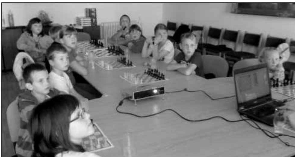
ŽÁCI NAPJATĚ POSLUCHAJÍ VÝKLAD O ZÁKLADNÍCH PRAVIDLECH ŠACHU