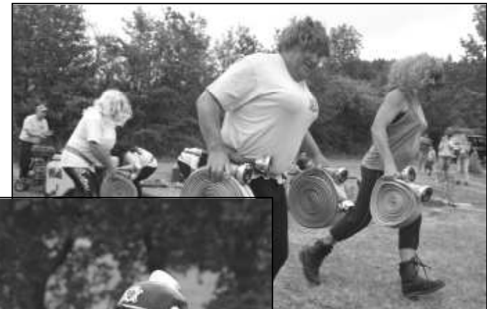
NOVĚ SESTAVENÉ DRUŽSTVO VÍTEŇSKÝCH ŽEN

Víteňský hasičský sbor byl založen v roce 1905. Na letošní rok tedy připadlo kulaté výročí založení tohoto úspěšného spolku. Víteňští připravili pro své příznivce příjemnou oslavu, která se uskutečnila v sobotu 1. srpna 2015.