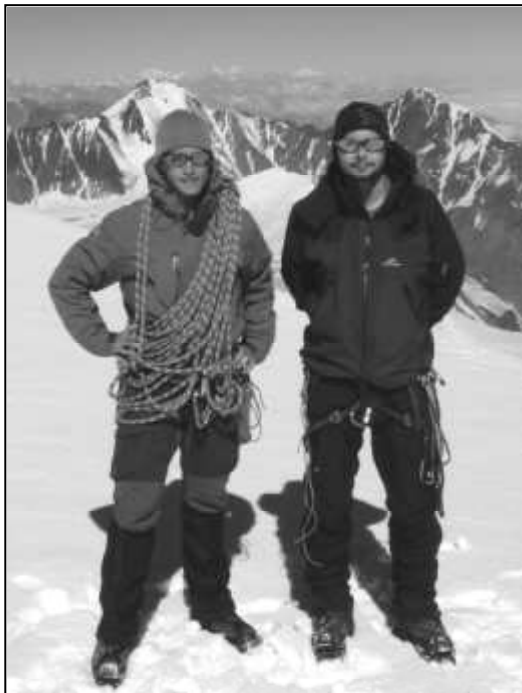
STRÁŽOVÁK NA VRCHOLU KAZBEKU

Trek je sice chozený, nicméně jeho první část není značená, a tak nás čekalo několikero brodění řeky, slaňování a podobná zpestření na trase, včetně dvou základen pohraničnicků. Poté, co celá výprava dorazila do města Kazbegi (Stepansminda), nás čekal už "jen" plánovaný výstup na Kazbek, horu sopečného původu s vrcholem 5 033 nebo 5 047 m n. m. (zdroje se liší).