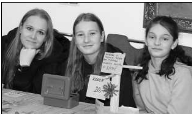
SVŮJ PRODEJNÍ STÁNEK MĚLI NA VÁNOČNÍM TRHU TAKÉ MLADÍ HASIČI Z VITNĚ