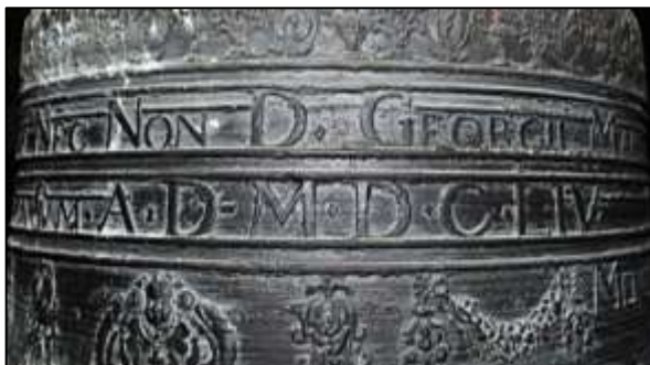
DETAIL NÁDHERNÉHO RELIÉFU ZVONU