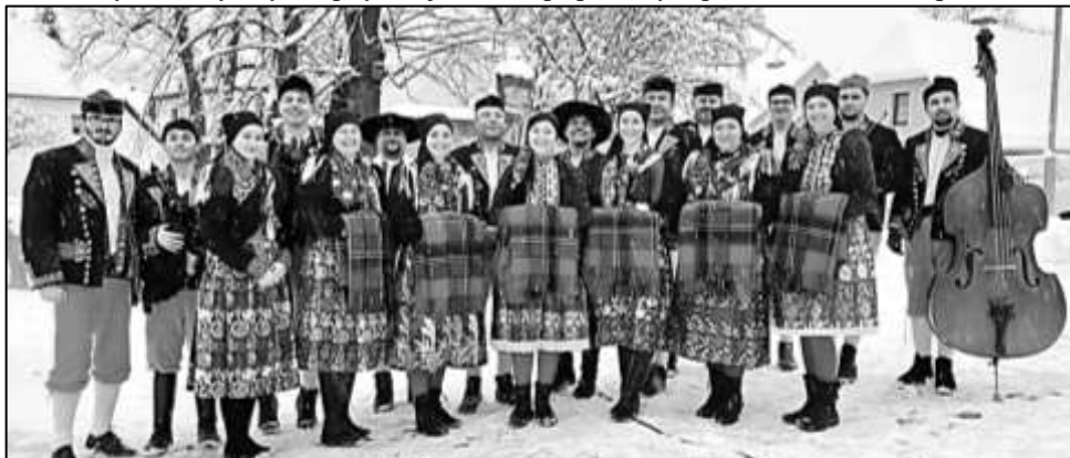
CHODSKÝ SOUBOR Z MRÁKOVA VYSTUPOVAL V TRADIČNÍCH KROJÍCH

Veliký věhlas získávají také Vánoce na hradě Opálka. Již třetí ročník této akce zaznamenal velikou účast. Stejně oblíbené je také zpívání u stromku ve Strážově. Letošní akce byla však výrazně omezena kvůli státnímu smutku z důvodu tragédie na Filozofické fakultě Univerzity Karlovy. Vystoupily tak jen děti s připraveným pásmem vánočních písní.