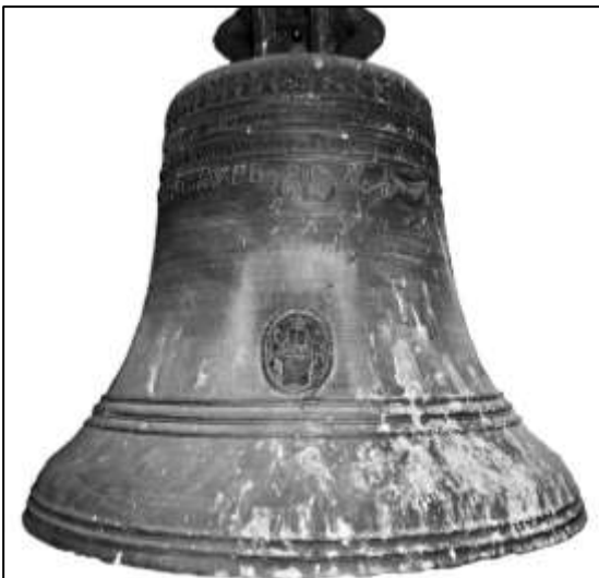
STRÁŽOVSKÝ ZVON BARTOLOMĚJ, LIDOVĚ ZVANÝ „BÁRTA“

částky na speciální účet zřízený k tomuto účelu. Jeho číslo je 6641541349/0800. Můžete přispět také hotově do pokladničky, která je umístěna na chodbě ve druhém patře budovy radnice. Kasičky budou zároveň umístěny na dostupných místech i při oslavách pětisetletého výročí města. Sběrka poběží ještě po celý zbytek roku. Snad již na přelomu let 2024 a 2025 se zvon opět rozezní.