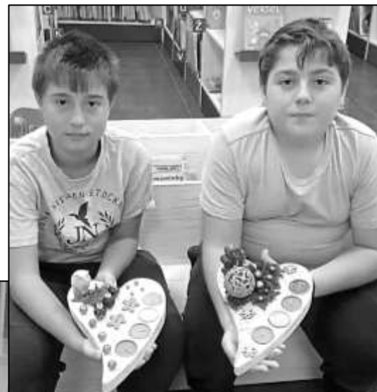
SOUROZENCI TOMANOVI Z OPÁLKY S VÝSLEDKEM ADVENTNÍHO TVOŘENÍ

Adventní období patří mezi nejkrásnější čas v roce. Děti se začínají těšit na Vánoce. Aby čas dětem rychleji a příjemněji ubíhal, připravila si místní knihovna pro děti výtvarnou dílnu s názvem Vánoční dekorace. Děti si mohly vyrobit srdíčko se čtyřmi plochami na čajové svíčky a při společném tvoření prožily krásné chvíle.