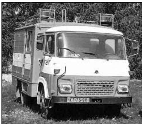
PŮVODNÍ VOZIDLO AVIA Z ROKU 1987

Na začátku ledna byl po dlouhém časovém prodlení s dodáním konečně převzat nový dopravní automobil pro SDH Viteň. Jedná se o osmimístné vozidlo na podvozku Mercedes Benz Sprinter s prostorem pro uložení nákladu a celkovou přípustnou hmotností 5 500 kg. Pořízení tohoto vozidla podpořilo svými dotačními prostředky Ministerstvo vnitra ČR (450 tisíc Kč) a Plzeňský kraj (300 tisíc Kč). Dodavatelskou firmou, která vzešla z veřejné zakázky, byla ostravská společnost HAGEMANN a.s. Auto stálo celkem 2 590 610 Kč, přičemž zbytek po odečtení dotací hradilo město ze svého rozpočtu.