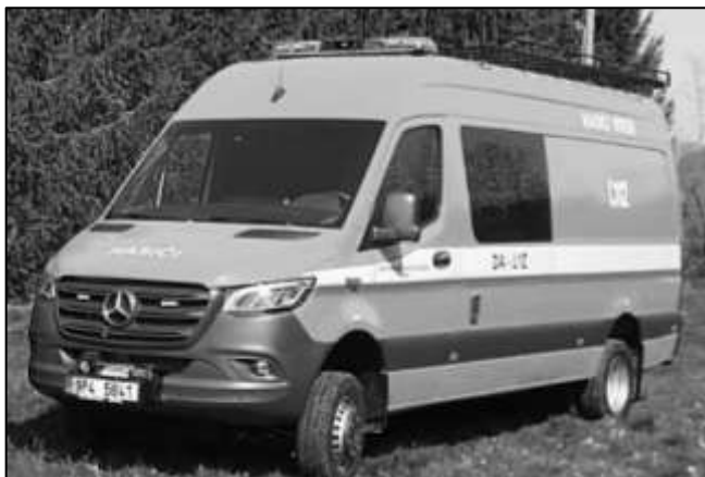
NOVÝ DOPRAVNÍ AUTOMOBIL MERCEDES

V letošním roce jsme byli úspěšní s dotační žádostí na pořízení automobilu pro SDH Zahorčice. I hasiči ze Zahorčic se tak mohou těšit, že do jejich garáže během pár měsíců přibude nové vozidlo.