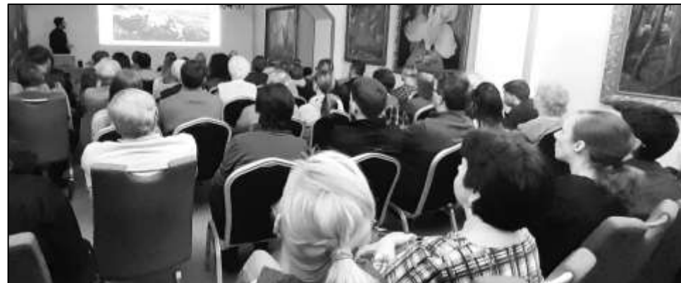
MNOHDY BÝVÁ ZASEDACÍ MÍSTNOST OBSAZENÁ DO POSLEDNÍHO MÍSTEČKA

V průměru okolo padesáti posluchačů se pravidelně zúčastňuje našich cestopisných a naučných přednášek, které každoročně pořádáme v zimních měsících v zasedací místnosti na radnici. I letošní zima byla pestrá a zajímavá. Poslechli jsme si, jak se žije ve Francii, projeli se na kole po Toskánsku a pěšky se prošli po svatojakubské cestě.