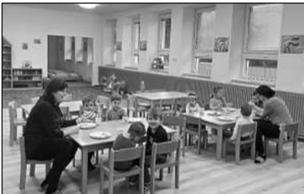
NOVÁ TŘÍDA MOTÝLKŮ V MATEŘSKÉ ŠKOLE SE RYCHLE ZAPLŇUJE NEJMENŠÍMI DĚTMI