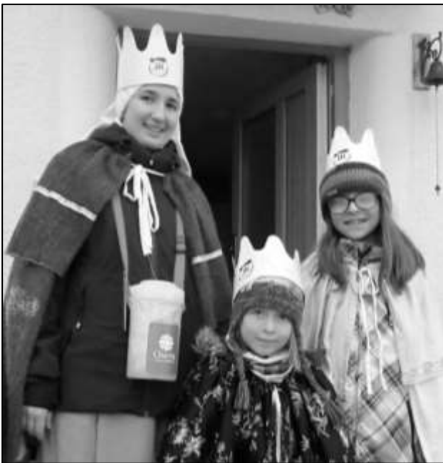
JEDNA Z OBĚTAVÝCH TŘÍKRÁLOVÝCH SKUPINEK

Letos se však kvůli nachlazením zapojily jen čtyři děti. O to náročnější to bylo pro všechny zúčastněné. Ke všemu navíc nepřálo počasí – jeden den deštivo, druhý den mrazivo, až to klouzalo. Děti nejvíce potěšily vykoledované sladkosti od štědrých sousedů a párky k obědu. Moc všem zúčastněným děkujeme! Charita České republiky je velice vděčná za příspěvky ve prospěch potřebných a na podporu charitních sociálních služeb a projektů.