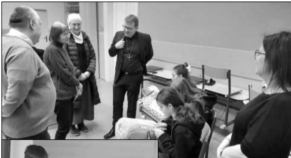
ŠIKOVNÉ KRAJKÁŘKY PŘEDVEDLY SVÉ UMĚNÍ